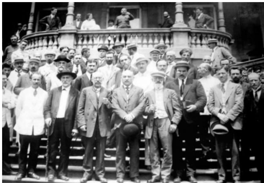
საქართველოს რესპუბლიკის პირველი მთავრობა (1918 წ. ივნისი)