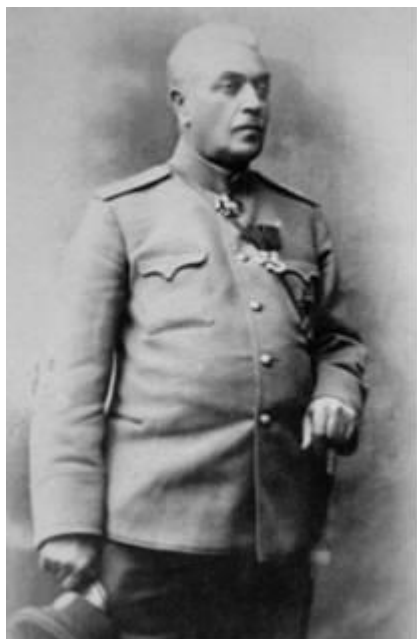
გენერალი თომას ნაზარბუქოვი