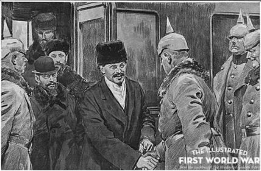
ტროცკისა და კამენევის ჩასვლა ბრესტ-ლიტოვსკში ცენტრალურ დიდ სახელმწიფოებთან მოლაპარაკებაზე