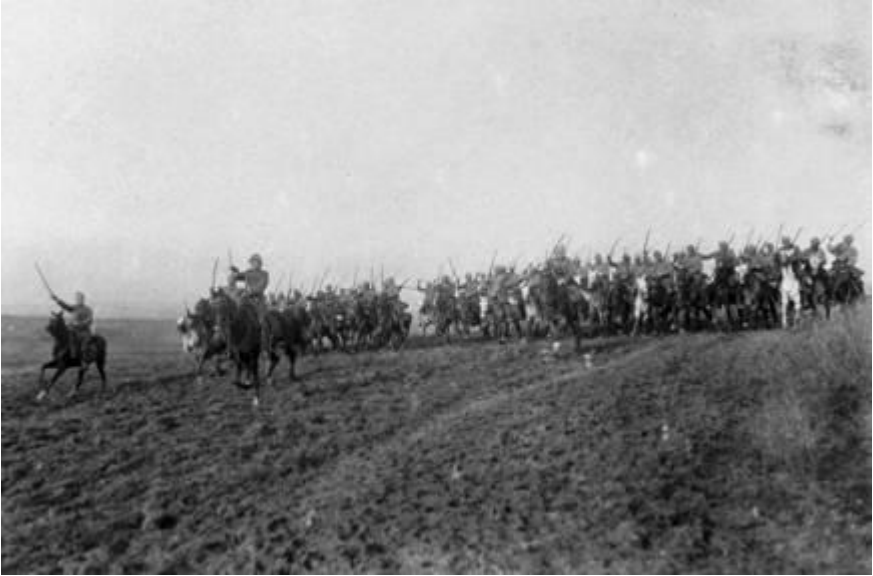
ოსმალთა კავალერია (1918 წ.)