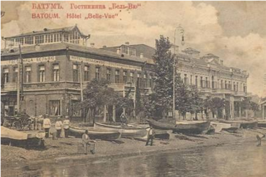
სასტუმრო „ბელ-ვიუ“ ბათუმში, სადაც 1918 წლის აპრილში განახლდა თურქეთისა და ამიერკავკასიის მოლაპარაკება ზავზე