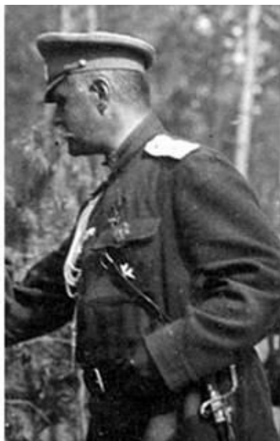
გენერალი ილია ოდიშელიძე