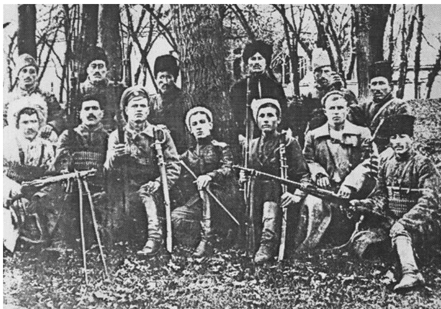
„რუსული მუღანის“ დამცველები (1918 წ. გაზაფხული)