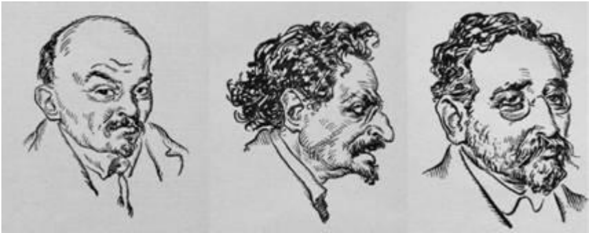
ლენინი, ტროცკი, კამენევი – 1918 წლის რუსული ანტიბოლშევიკური კარიკატურები