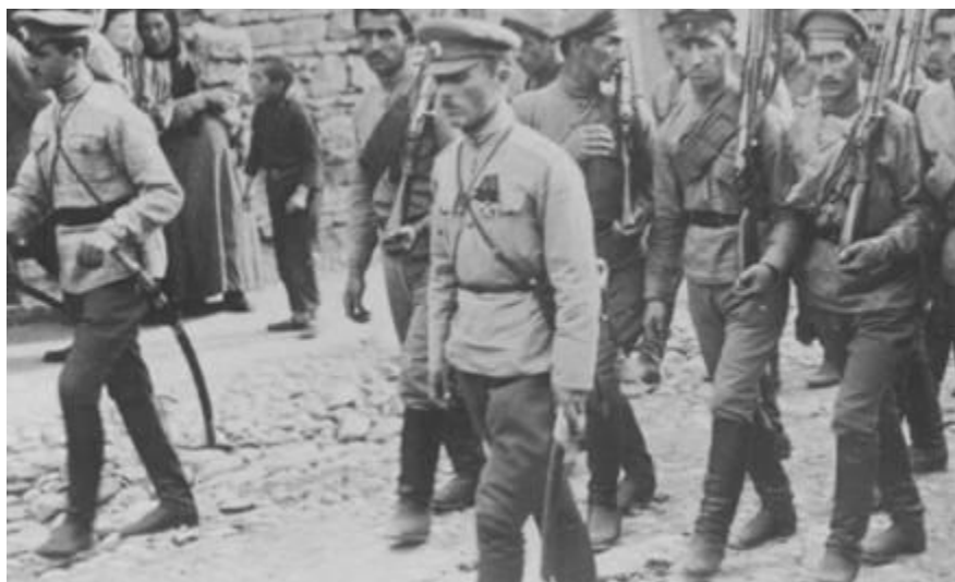
ქართული ქვეითი ჯარი (1918 წ.)