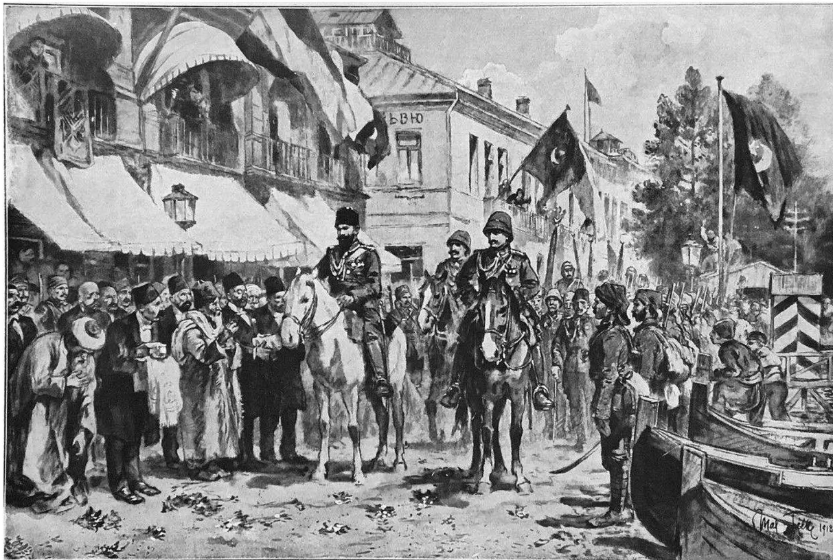
თურქების ჯარი ბათუმში შემოდის