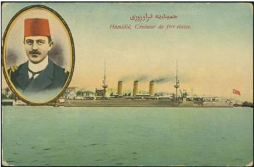
რაუფ-ბეი ორზაი თურქულ ღია ბარათზე (1918 წ.)