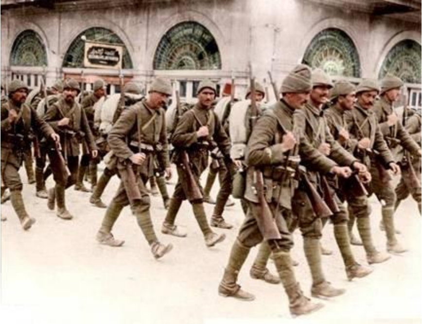
ოსმალთა ქვეითი ჯარი (1918 წ.)