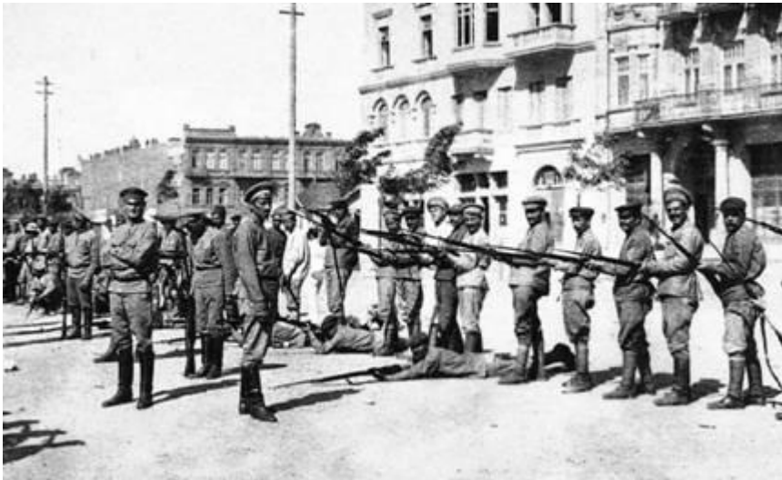
სომეხი მილიცია (1918 წ.)